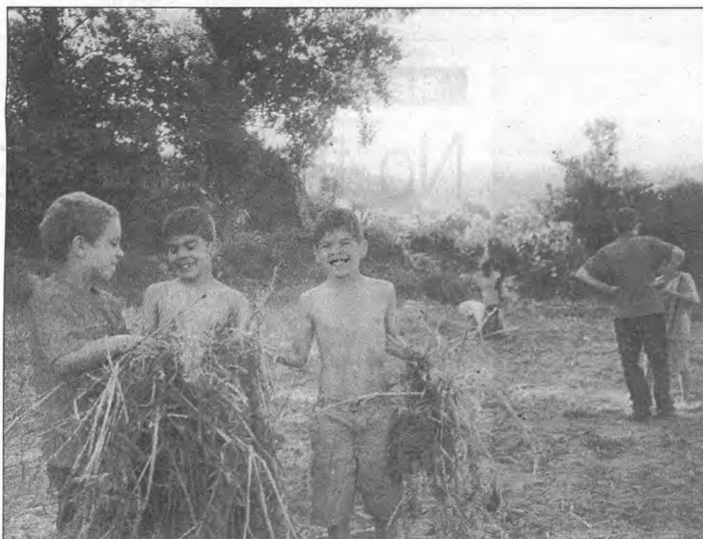
O calor do Verão na Casa do Gaiato de Paço de Sousa

Tiragem média d'O GAIATO, por edição, no mês de Junho, 62.900 exemplares.