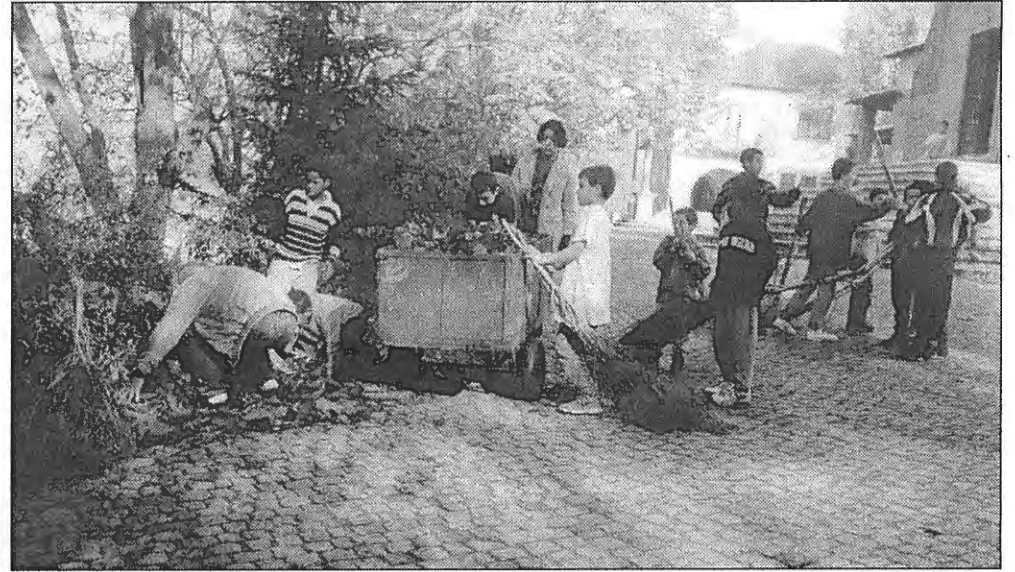
Limpeza frente ao edifício da casa-mãe da nossa Aldeia.

Estou farto de saber que não devemos dar