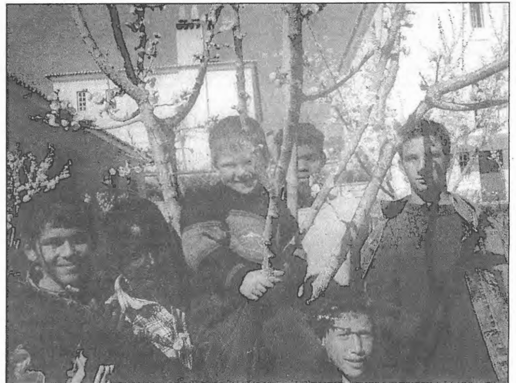
Casa do Gaiato de Miranda do Corvo.

Os Iniciados realizaram 34 jogos, obtiveram 28 vitórias; 5 derrotas e 1 empate. Sofreram 82 e marcaram 183 golos. Os três melhores marcadores foram: Fábio, 40; «Azeitona», 33 (com menos 9 jogos); «Doutor» e Abílio, 19. Nestes números não incluímos o jogo e o resultado de 6 de Abril, pelo simples facto de este não ter o mesmo espírito de confraternização que os restantes. Nós continuamos a dizer que, nestas nossas andanças de «futebois», o resultado vem por acréscimo.